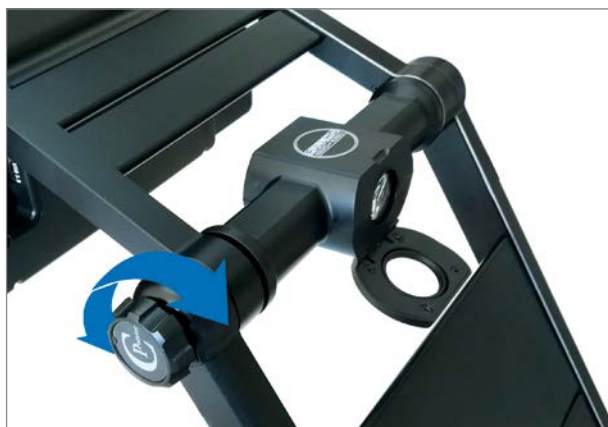
ClearView GO 15