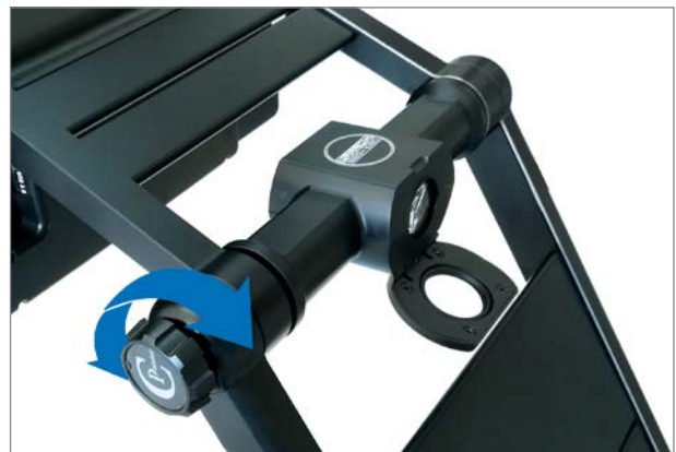
ClearView GO 15