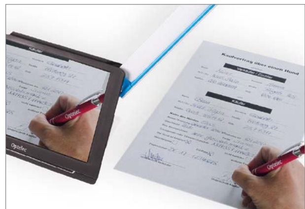
Kameraarm VISULEX® Compact 10HD Speech

Schutztasche, Netzteil, Anleitung, Reinigungstuch